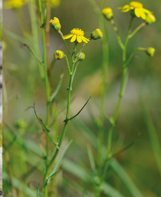
Seit kurzem breitet sich das giftige Schmalblättrige Kreuzkraut aus, das ursprünglich aus Südafrika stammt.