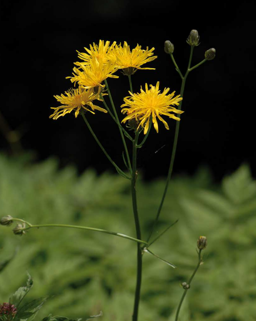
Der harmlose Wiesenpippau hat im Gegensatz zu Kreuzkräutern nur Zungenblüten.