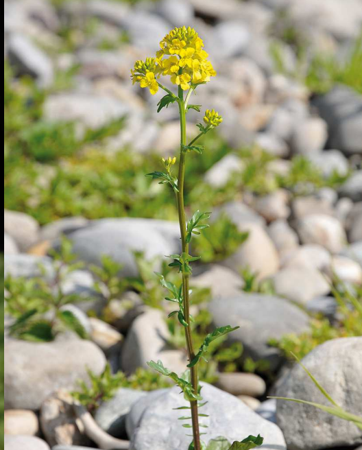
Das ebenfalls harmlose Barbarakraut unterscheidet sich von den Kreuzkräutern durch seine vier Blütenblätter.